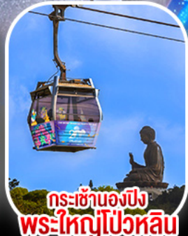
กระเซ่านองปิง พระใหญ่โป้วหลิน