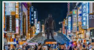
ถนนแดนดินแดนเซี่ยงหนิง