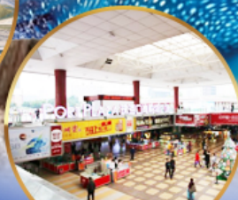
ตลาดกังเป๋