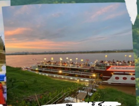
ลองเรือแม่ฟ้าหลวง