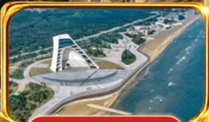
หอดอยกาลเวลา