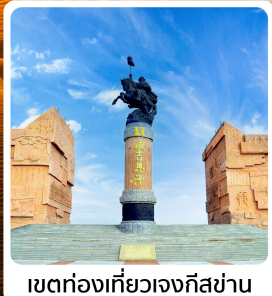
เขตท่องเที่ยวเจงกีสข่าน