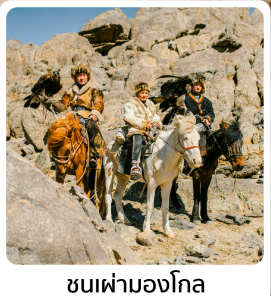
ชนเผ่ามองโก