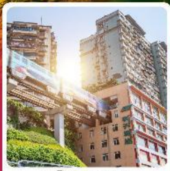
รถไฟฟ้ากะลุดึก