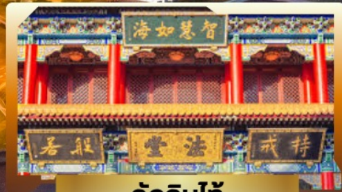
วัดจันทน์