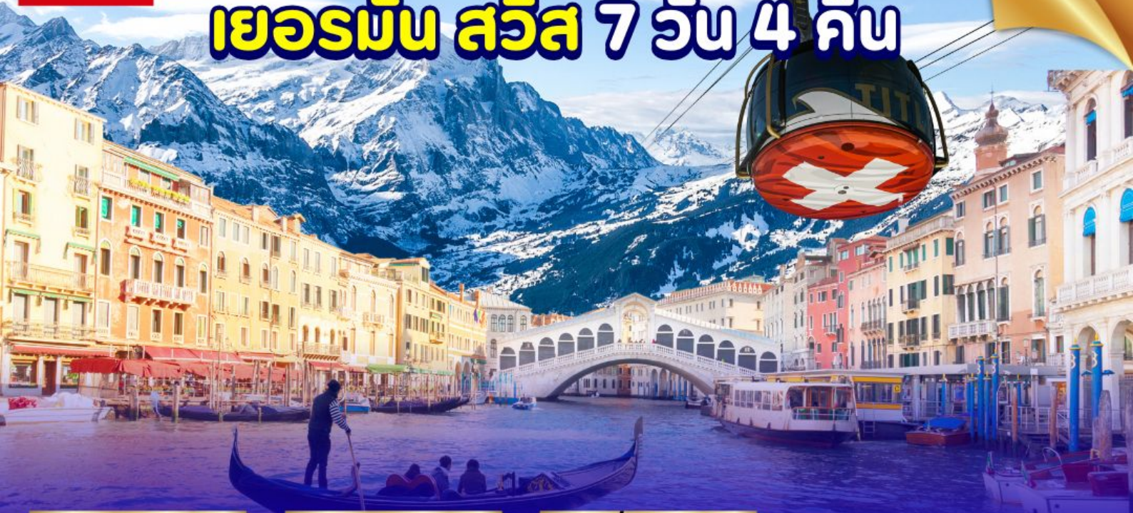
ยอดเขากิตติส