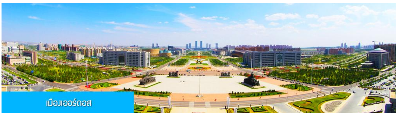
เมืองเออร์ดอส