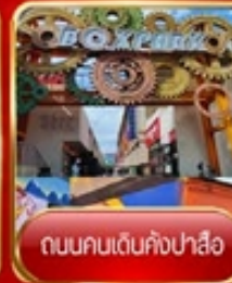
ถนนคนเดินคังปาสือ