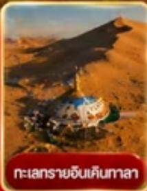
ทะเลทรายอินคินทาลา