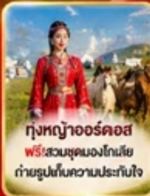
ทุ่งหญ้าออร์ดอส ฟรี! สวมชุดมองโกเลีย ถ่ายรูปเก็บความประทับใจ