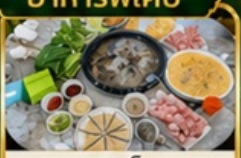
ชาชูเหิด