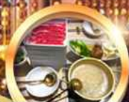
บุฟเฟ่ต์ชาบู เบื่อไม่อั้น!!