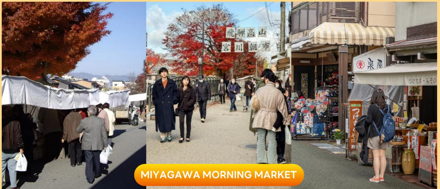
MIYAGAWA MORNING MARKET

จากนั้นนำท่านชม วัดฮิดะโคคุบุบุนจิ (Hida Kokubunji Temple) เป็นวัดพุทธที่เป็นเหมือนสัญลักษณ์ของเมืองทาดายาม่า เจดีย์สามชั้นองค์นี้สร้างขึ้นในปี 1820 ภายในอุโบสถมีพระพุทธรูปที่สร้างขึ้นในยุคเฮอันให้สักการะ ภายในบริเวณวัดมีต้นแปะก๊วยขนาดใหญ่ที่ว่ากันว่ามียุถึง 1,250 ปี ที่ใครมาทาดายาม่าก็ต้องไปชมเลยทีเดีย (ราคาทัวร์รวมค่าเช้า) (การเปลี่ยนสีของใบไม้ ขึ้นอยู่กับสภาพอากาศเป็นสำคัญ)