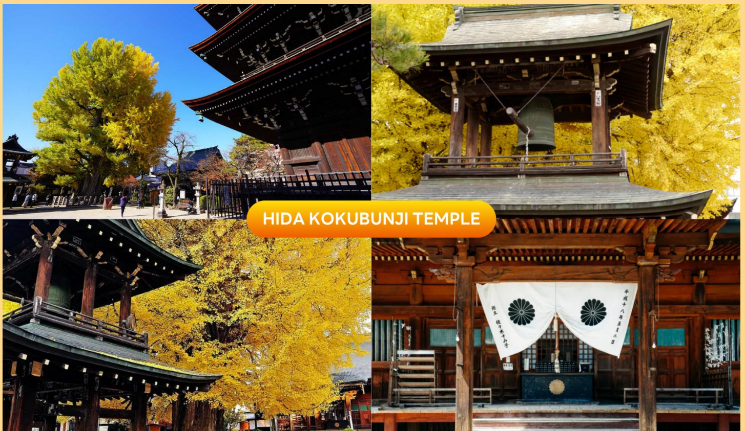
HIDA KOKUBUNJI TEMPLE

จากนั้นนำท่านชม วัดฮิดะโคคุบุบุนจิ (Hida Kokubunji Temple) เป็นวัดพุทธที่เป็นเหมือนสัญลักษณ์ของเมืองทาดายาม่า เจดีย์สามชั้นองค์นี้สร้างขึ้นในปี 1820 ภายในอุโบสถมีพระพุทธรูปที่สร้างขึ้นในยุคเฮอันให้สักการะ ภายในบริเวณวัดมีต้นแปะก๊วยขนาดใหญ่ที่ว่ากันว่ามียุถึง 1,250 ปี ที่ใครมาทาดายาม่าก็ต้องไปชมเลยทีเดีย (ราคาทัวร์รวมค่าเช้า) (การเปลี่ยนสีของใบไม้ ขึ้นอยู่กับสภาพอากาศเป็นสำคัญ)