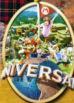
อิสระเลือกซื้อบัตร Universal Studios Japan