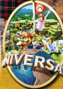
อิสระเลือกซื้อบัตร Universal Studios Japan