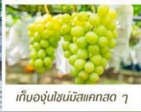
เก็บองุ่นไซน์มิสแคสตา ๆ

🇯🇵 เที่ยวเกาะ - โอซาก้า (รวมบัตรเข้าสวนสนุก USJ)