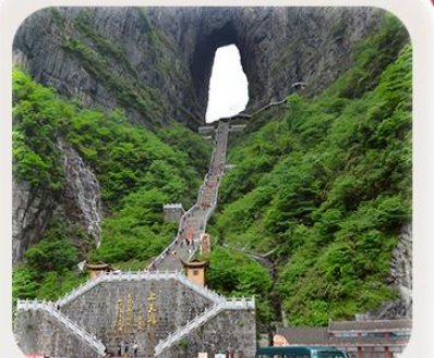
“กำประตูลิ่ว”