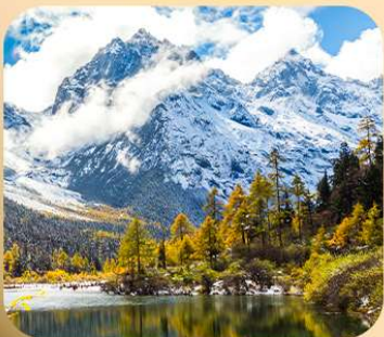
“ปี่ฝิงโกว”

ชมธรรมชาติ 2 อุทยานขึ้นชื่อ อุทยานภูเขาสี่ดรุณี + อุทยานปี่ฝิงโกว สะพานหนานเฉียว • ถนนคนเดินไถ่กู่หลี่ + ชุนซีลู่ + Pop Mart • ตงเจียวจี้