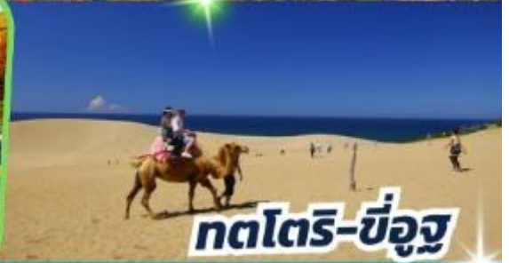
ทตโตริ-ซึจูกู