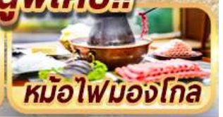
หม้อไฟมองโกล