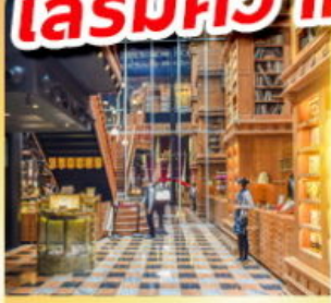
ร้านไอศกรีมมียาฮ่า