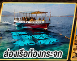
ล่องเรือท้องกระจก