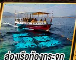
ล่องเรือท้องกระจก