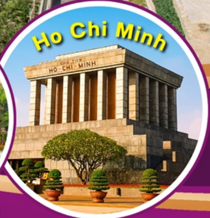
Ho Chi Minh