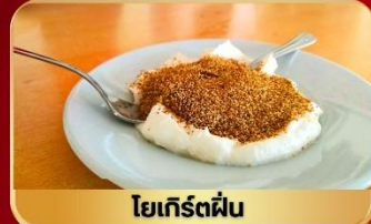
โยเกิร์ตผืน