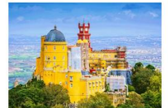
พระราชวังพินา

** พักที่ Mercure Lisbon Hotel 4* หรือเทียบเท่า **