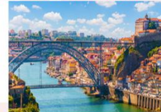
สะพาน Luís I Bridge

** พักที่ Mercure Lisbon Hotel 4* หรือเทียบเท่า **