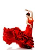
ชมระบำฟลามิงโก

** พักที่ Hilton Garden Inn Sevilla Hotel 4* หรือเทียบเท่า **