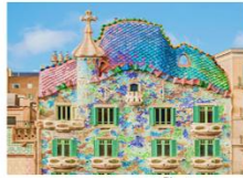
มหาวิหารซากราดา แฟมิลีย ปาร์ค กูเอล คาซ่าบัตโล่

** พักที่ Best Western Barcelona Hotel 4* หรือเทียบเท่า **