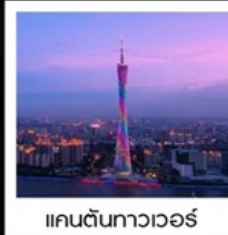
แคนตันทาวเวอร์