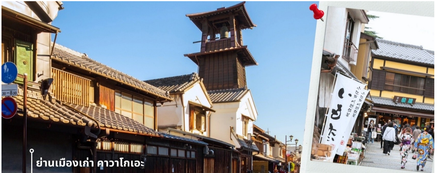
ย่านเมืองเก่า คาวาโกเอะ

08.00 น. เดินทางถึงสนามบินนาริตะ ประเทศญี่ปุ่น หลังจากผ่านพิธีตรวจคนเข้าเมืองและศุลกากรแล้ว นำท่านขึ้นรถโค้ชปรับอากาศ พาท่านเดินทางสู่ นำท่านเดินทางสู่ ย่านเมืองเก่าคาวาโกเอะ เมืองเก่าที่ได้รับสมญานามว่า “เอโดะน้อย” ด้วยความโดดเด่นของอาคารสไตล์แบบญี่ปุ่นดั้งเดิม ที่เรียงรายสองฝั่งถนนอย่างมีเสน่ห์ ราวกับได้ย้อนเวลากลับไปในยุคเอโดะ ใจกลางเมืองแห่งนี้คือ ถนนคุระซุกุริ Kurazukuri-dori ที่เต็มไปด้วยร้านค้าท้องถิ่น คาเฟ่ขนมหวาน และของฝากสไตล์ญี่ปุ่นโบราณ การเดินเล่นที่นี่ไม่ใช่แค่การเที่ยวชมสถาปัตยกรรม แต่ยังได้ซึมซับบรรยากาศที่เงียบสงบ มีเสน่ห์เฉพาะตัว เหมาะสำหรับการถ่ายรูปและเรียนรู้วัฒนธรรมญี่ปุ่นในแบบที่จับต้องได้ สัญลักษณ์สำคัญของเมืองคือ “หอรชิ่งโทคิโนะคานะ” (Toki no Kane) ที่ยังคงดังบอกเวลาวันละ 4 ครั้ง เป็นเสียงแห่งอดีตที่ยังสะท้อนอยู่ในปัจจุบัน ไม่ไกลกัน มีถนนขนมหวานคาชิยะ โยโกโช (Kashiya Yokocho) ซอยเล็ก ๆ ที่เต็มไปด้วยกลิ่นหอมของมันหวาน ลูกอมโบราณ และขนมญี่ปุ่นหลากชนิด ให้เลือกชิมและซื้อกลับบ้านเป็นของฝาก ให้ท่านได้อิสระเดินตามอัธยาศัย