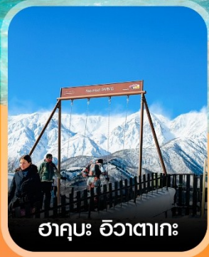
ฮาคูบะ อิวาตาเกะ