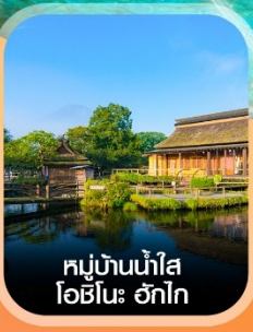
หมู่บ้านน้ำใส โอชิโนะ ฮักไก

✈️ คอนเฟิร์มออกเดินทาง ทุกพีเรียด 2 ท่านขึ้นไป