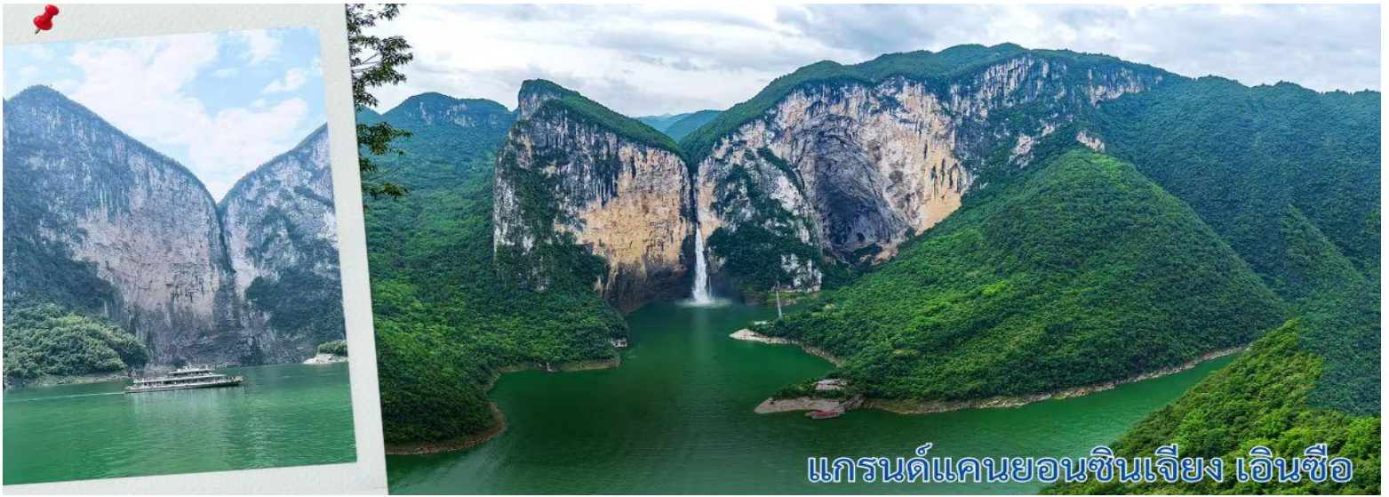
แกรนด์แคนยอนซินเจียง เอ็นซือ