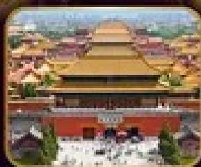
เจิวบรมถโลก