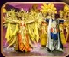
การแสดงโขนจีน-การตา