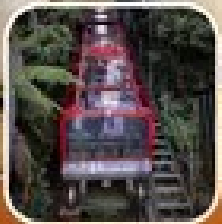
เที่ยวชมอุทยานแห่งชาติ