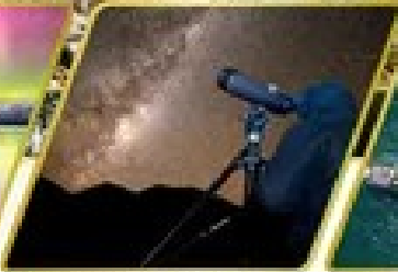
กิจกรรมชมทิวทัศน์ดาว