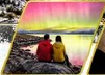
ตามล่าหาแสงใต้