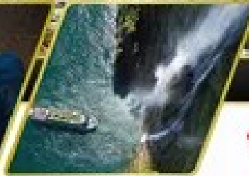
ล่องเรือมิลฟอร์ด ซาวน์