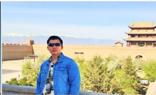
ป้อมปราการเจียยวี่กวน (Jiayuguan Fort)