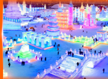
เที่ยว ICE & SNOW WORLD