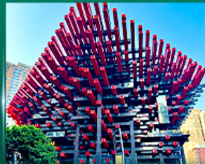
เข้ฉฉันตึกตะเกียบ