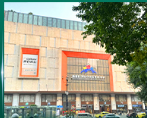
ศูนย์การค้าส่งเสื่อฟ้าไฟไฟสโตร์