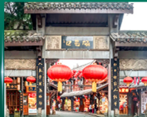
หมู่บ้านโบราณฉิวฉิว