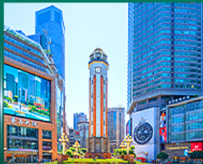
ช้อปปิ้งย่านเจียงฟางเม่ย

OPTION ซีตี้ร่งซิง ชบเพนฉ่า, POPMART, ژیอเปี๊ยะ, ถนนคนเดิน