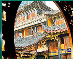
วัดพรวิฑลว้ฉัน