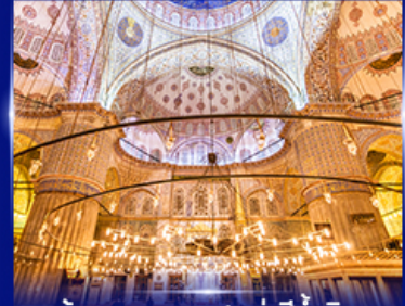
เข้าชมความงามสุเหร่าสีน้ำเงิน