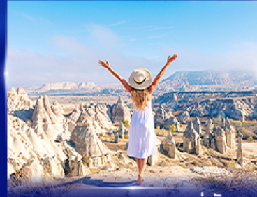
ชมความงดงาม หุบเขาแห่งรัก