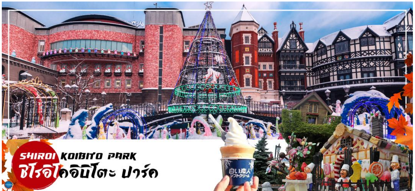
SHIROI KOIBITO PARK ชิโรอิคอบิตะ ปาร์ค

นำท่านสู่ หมู่บ้านช็อคโกแลต อิชิยะ (Shiroi Koibito Park by Ishiya) (ด้านนอก) แหล่งผลิตช็อคโกแลตที่มีชื่อเสียงของญี่ปุ่น ตัวอาคารของ โรงงานถูกสร้างขึ้นในสไตล์ยุโรป แวดล้อมไปด้วยสวนดอกไม้ จึงทำให้บรรยากาศของหมู่บ้านช็อคโกแลตที่นี่ดูคลาสสิกและน่ารักไปอีกแบบช็อคโกแลตที่ขึ้นชื่อที่สุดของที่นี่คือ Shiroi Koibito ซึ่งมีความหมายว่าช็อคโกแลตขาวแต่คนรัก ท่านสามารถเลือกซื้อกลับไปให้คนที่ท่านรักทานหรือว่าซื้อเป็นของฝาก ติดไม้ติดมือกลับบ้านก็ได้ นอกจากนี้ท่านจะได้เลือกซื้อช็อคโกแลตที่หาซื้อที่ไหนไม่ได้ และท่านก็ยังจะได้ชมประวัติความเป็นมาของโรงงาน และการผลิตช็อคโกแลตอีกด้วย