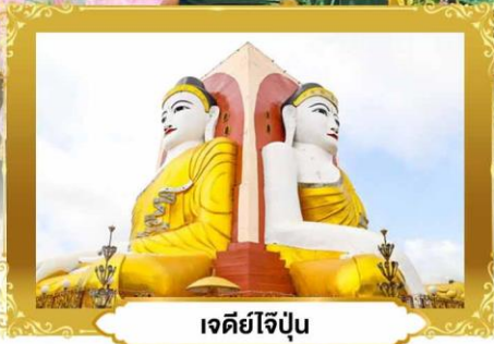
เจดีย์ไจ้ปูน