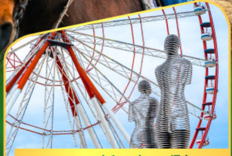
อนุสาวรีย์อาลีและนีโน่