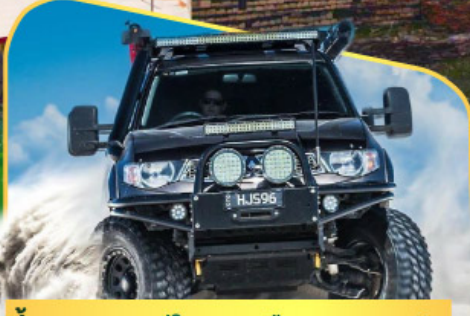
ขึ้นรถ 4WD สู้ใจกลางเทือกเขาคอเคซัส