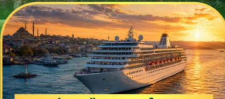
ล่องเรือทะเลดำ