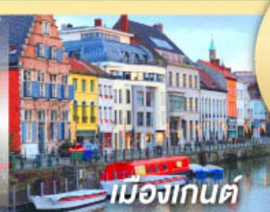
เมืองเกนต์