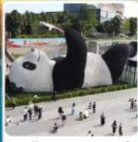
รูปปั้นแพนด้าเซลฟ์