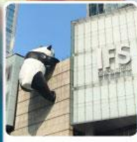
แพนด้ายักษ์ปิ่นตักIFS