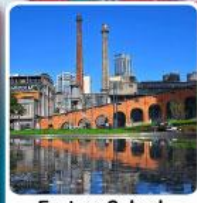
Eastern Suburb Memory Chengdu