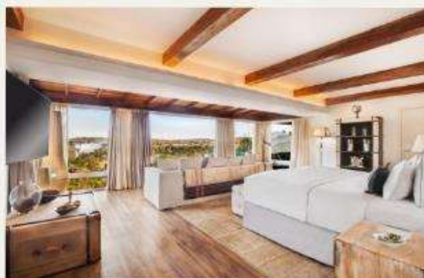
Hotel das Cataratas, A Belmond Hotel