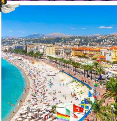
เฟรนช์ริเวียร์