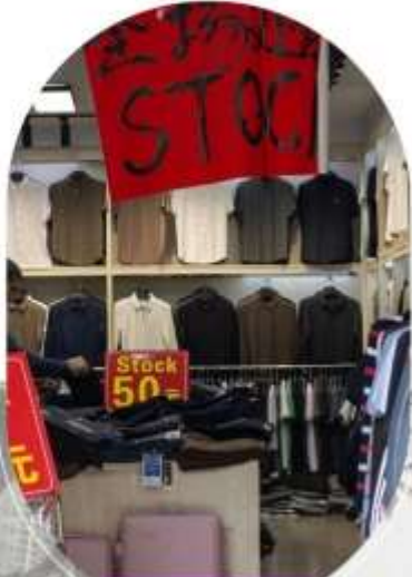
ตลาดค้าส่งอู่