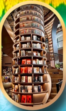
ร้านขายหนังสือ