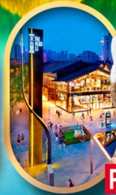
ถนนคนเดินไท่กู่หลี่