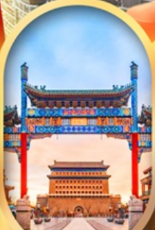
ถนนคนเดินเจียนเหมิน