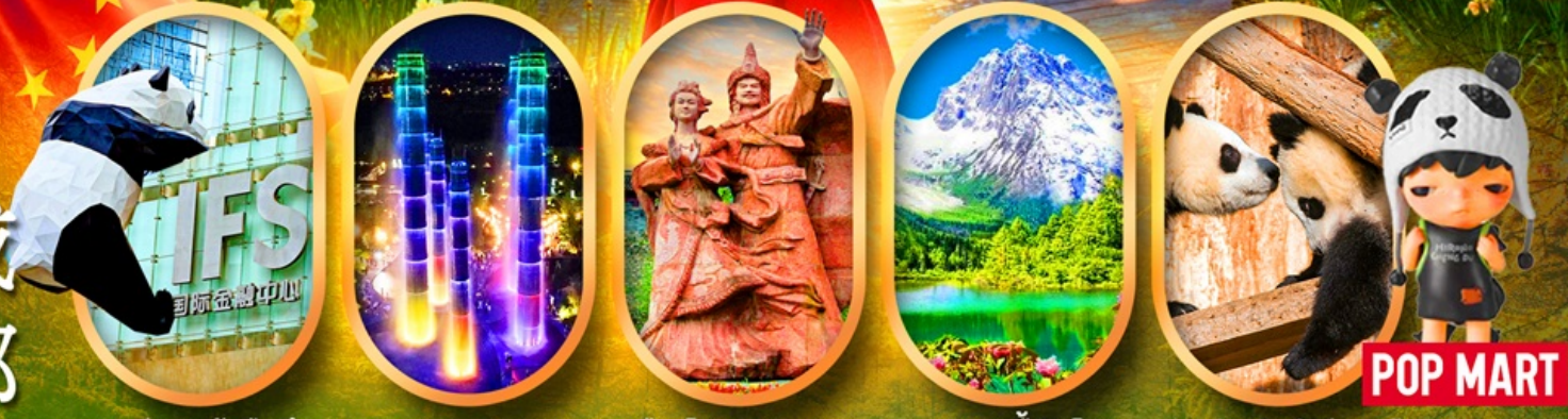
IFS หมีแพนด้าป็นตึก SKP Global Center เมืองโบราณซงฟาน อุทยานปี้เฉิงโกว ศูนย์อนุรักษ์หมีแพนด้า

เจิงตู ปี้เฉิงโกว จิวจ้ายโกว หมีแพนด้าตัวเป็นๆ