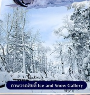
ภาพวาดน้ำแข็ง Ice and Snow Gallery