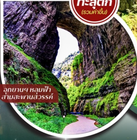
อุทยานฯ หลุมฟ้า สามสะพานสวรรค์