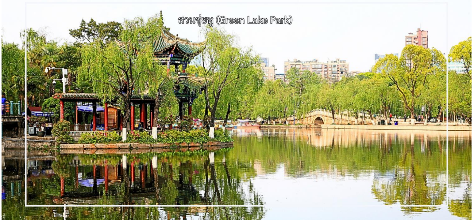
สวนชู่หู (Green Lake Park)

จากนั้นนำท่าน ชมทิวทัศน์ภาพ สวนชู่หู (Green Lake Park) เป็นสวนสาธารณะใจกลางเมืองคุนหมิงที่มีชื่อเสียงและได้รับความนิยมอย่างมาก โดดเด่นด้วยทะเลสาบสีเขียวมรกตที่โอบล้อมด้วยต้นไม้ร่มรื่น และบรรยากาศผ่อนคลาย เหมาะแก่การพักผ่อนและเดินเล่น สวนแห่งนี้เป็นศูนย์รวมวิถีชีวิตของชาวคุนหมิง นักท่องเที่ยวสามารถชมกิจกรรมท้องถิ่น สัมผัสบรรยากาศธรรมชาติ และถ่ายภาพความสวยงามของสวนในทุกฤดูกาล