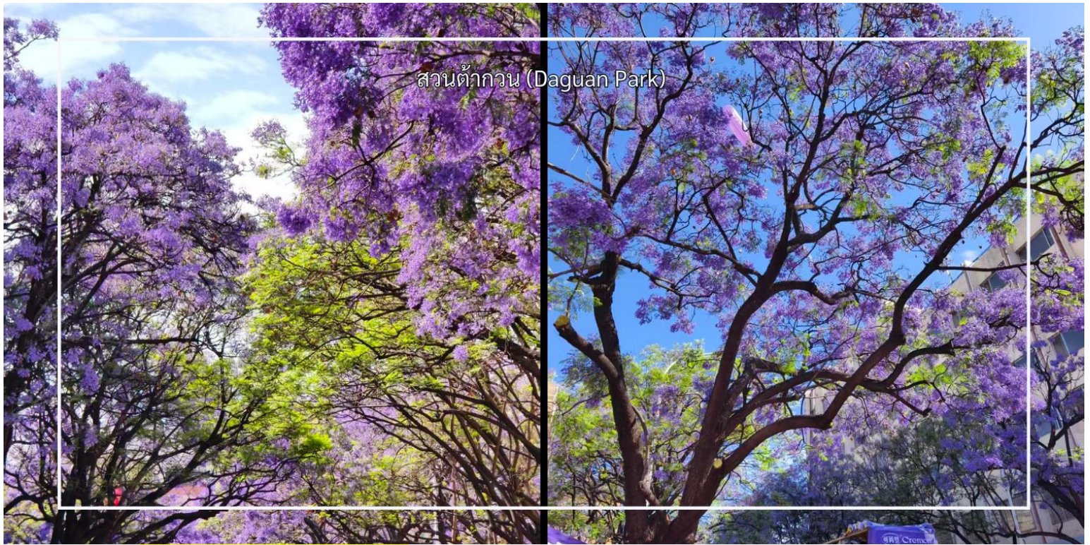
สวนต้ากวน (Daguan Park)