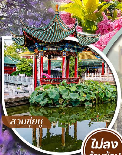
สวนชู้ยู่