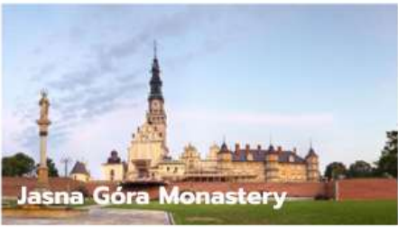
Jasna Góra Monastery