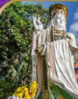
เจ้าแม่กวนอิม สวีลิสเบย์