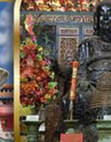
วัดปึกใต้